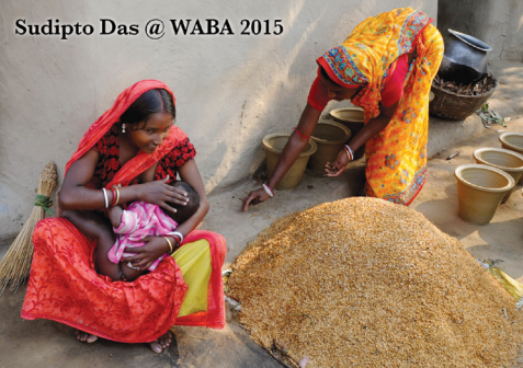
As fotos são das ganhadoras do concurso de fotos da Semana Mundial da Amamentação 2015

© 2015 Todos os Direitos Reservados aos Fotógrafos e a WABA.