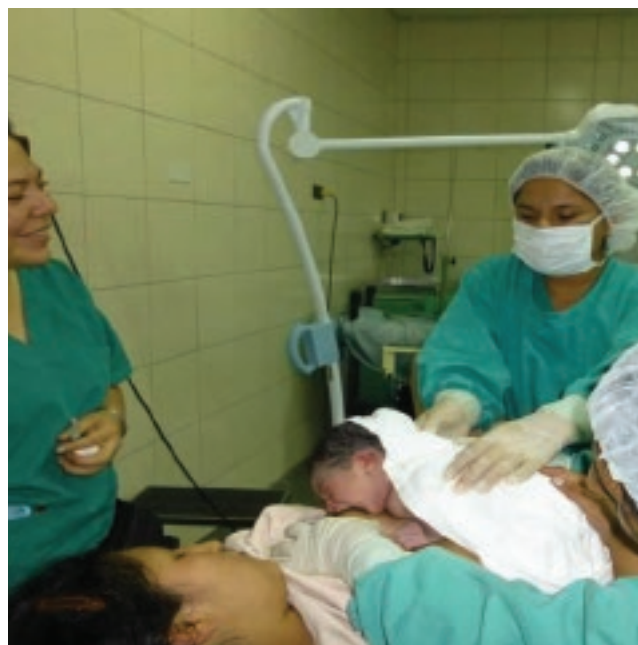
Delly Mishu © WABA 2013

L'ensemble des gouvernements s'accordent à dire qu'il faut donner la priorité à l'objectif mondial de l'assemblée mondiale de la santé (World Health Assembly, WHA), qui veut augmenter le taux de l'allaitement exclusif dans les 6 premiers mois de la vie de 50% d'ici à 2025. Plaidons ensemble pour transformer les éléments probants en actions pour l'allaitement maternel.