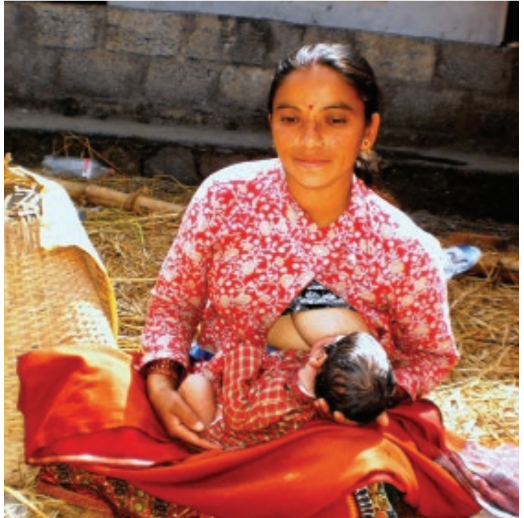
Gokul Pathak © WABA 2013

Les messages de plaidoyer doivent inclure les problèmes environnementaux comme la lutte contre l'usage abusif des pesticides et des engrais. Le partenariat avec les organisations locales d'appui aux pauvres et aux groupes marginalisés devrait être une priorité. Enfin, le Code International de Commercialisation des Substituts du Lait maternel est un cadre propice à la réglementation de l'industrie de production des substituts du lait maternel. Ce code aide à sauvegarder à la fois l'environnement et le droit d'allaiter. Nous devons veiller à ce qu'il soit appliqué et surveillé efficacement.