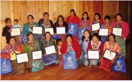
16 زميل من المستشارين يتخرجون من برنامجهم التدريبي في سانتا لوسيا لا ريفورما، توتونيكابان، جواتيمالا