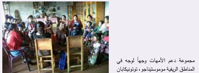
مجموعة دعم الأمهات وجهاً لوجه في المناطق الريفية موموستيناجو، توتونيكابان