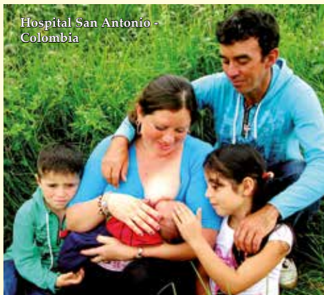
Hospital San Antonio - Colombia