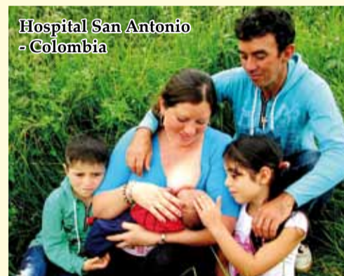
Hospital San Antonio - Colombia