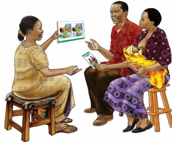
Counselling Cards for Community Workers

ما الذي يمكن لمنسقي شؤون الرضاعة الطبيعية فعله؟