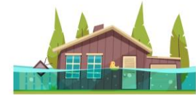
"Designed by macrovector / Freepik"

ما الذي يمكن لمنسقي شؤون الرضاعة الطبيعية فعله؟