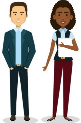
"Designed by studiogstock / Freepik"

ضمان حماية ودعم وتعزيز الرضاعة الطبيعية بشكل خاص ضمن الخطط الوطنية للتأهب والاستجابة في حالات الطوارئ.