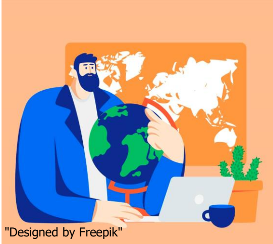
"Designed by Freepik"